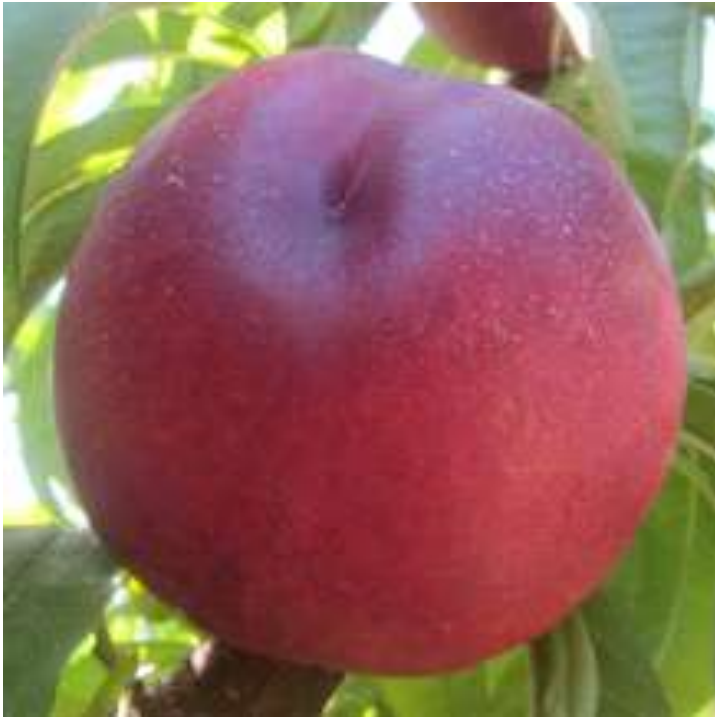
Nectarina amarilla Extreme © 618 - Foto Viveros Provedo http://bit.ly/2bOTM3E