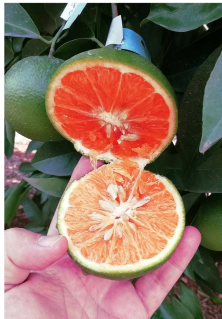
Nova presenta alrededor de 20 semillas por fruto