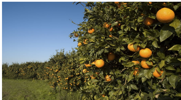
Extensión de cultivos con árboles de mandarinas

En cuanto a la producción, la recolección total de la mandarina Nadorcott en la presente campaña ha sido un 4,6% superior a la producción recolectada durante el mismo periodo de la campaña anterior.