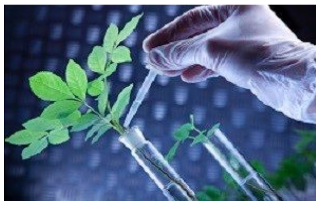
Simulación de procesos de reproducción de nuevas variedades