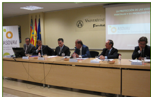
Mesa de Debate con sus participantes

tion en el período que media entre la presentación de la solicitud o su publicación (según contemplemos normati-