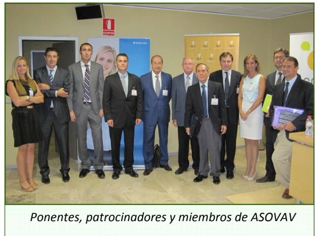
Ponentes, patrocinadores y miembros de ASOVAV

organismo de una Comisión especial que acuda al Consejo Europeo y exija que se aplique de manera correcta la justicia en materia de protección de las obtenciones vegetales en el territorio de la Unión Europea. Comentó, asimismo, que AVA-ASAJA también transmitirá todas estas situaciones a las autoridades valencianas.